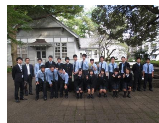
理工学コース(学習院大)

首都大 キャンパスの雰囲気は静かで落ち着いていた。養護教諭や助産師の資格も取れる。 目白大 研修用のベッドや風呂、患者の家を再現したようなセットまであり設備が充実していた。