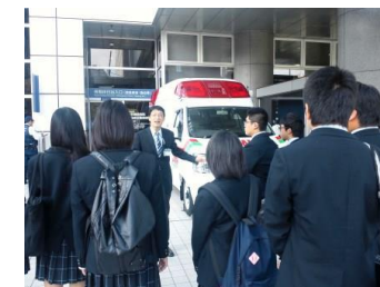
薬学コース(昭和大) 付属病院で実習の説明を受ける。

東京理科大 関門制度という進級テストがあり、それが社会に出てから役に立っていると聞き、レベルが高いと感じた。DDS研究センターという、薬がどう伝わっていくかを調べる研究センターがある。勉強はとて大変そうだろうが、その分知識が人一倍ある薬剤師になることができる大学だと思った。