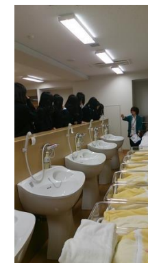
保健医療コース(首都大) 新生児実習施設