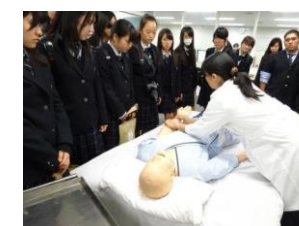
医学コース(東邦大) 脈拍をとってみよう