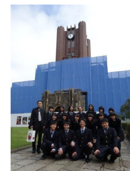
医学コース(東大) 安田講堂前にて

昭和大 チーム医療ができる。病院が隣にあるので4年生から本格的な場所で研修ができる。病院内にある調剤室などを見学することが実際に働いている薬剤師の仕事が間近で見ることができ勉強になった。世界での社会で活躍できるランキング359位(日本で3位)