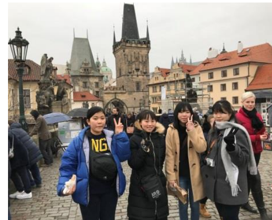
(プラハ・カレル橋にて)