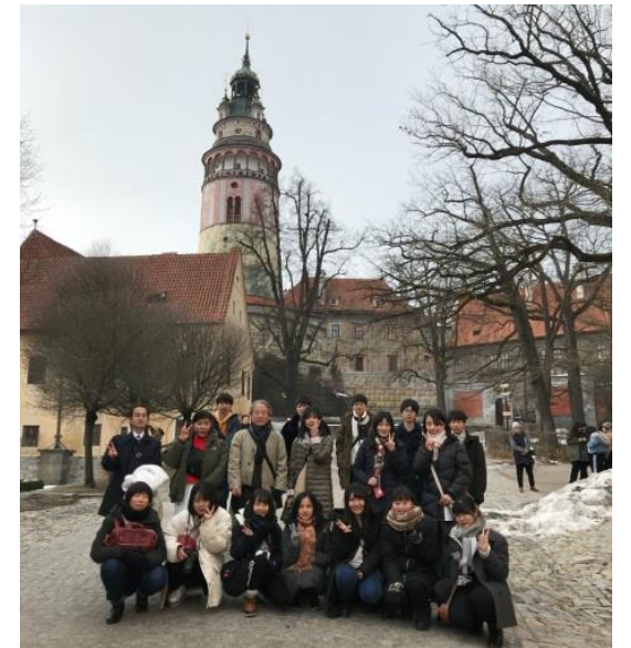
(チェスケーグルムロフにて)

プラハ最終日に、20年に一度の大雪に見舞われ、飛行機の欠航が心配されましたが、遅延はしたものの無事に帰国でき、有意義な4泊6日の旅となりました。